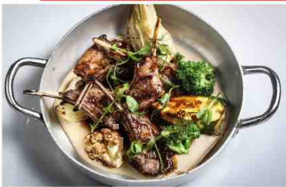
דקורציות חג. Shine & Sharp

מסעדת Shine & Sharp, יגאל אלון 65, תל אביב. טלפון 03-5364755