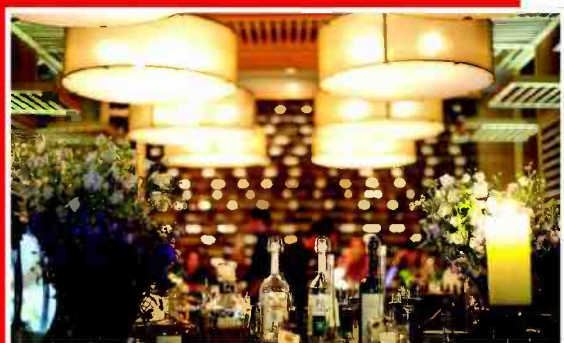
נתחי בשר לאוהבים. "הרברט סמואל" תל אביב

בט"ו באב תוכלו לבחור איך לחגוג את הזוגיות: סופשבוע של רומנטיקה קלאסית ב"הרברט סמואל" בתל אביב, או ערב זוגי על תאוות הבשרים ב"הרברט סמואל" הכי שרה כהרצליה. מיוחד לט"ו באב: מנות לחלוקה לזוגות האוהבים מדגים שלמים מהים התיכון + נתחי בשר גדולים + קוקטייל מיוחד ליום האהבה, אהבת הפי למינגו על בסיס וודקה קוואנטרו מיץ לימון טרי.