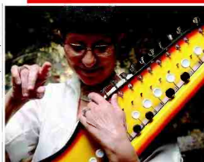
קבלת שבת. עוזרי

"דובע דרכי הבשמים" במצפה רמון יהפוך בט"ו באב למתחם של מועדוני מוזיקה, מסיבות ואמנות, כמו גם אירועים מיוחדים לחג האהבה בכרמים בפאתי מצפה רמון.