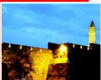
אהבה היסטורית. חומות ירושלים

בית שמואל הירושלמי מציע לכבוד ט"ו באב סיור מיוחד בליל ירח מלא, על טיילת החומות בירושלים. ההשראה מגיעה מחג האהבה היהודי, שבו בנות ישראל יצאו לכי רמים לבושות לבן. ואם לא ידעתם, אז גם לילות ירושלים (לא רק לילות תל אביב) גדושים סיפורי אהבה קסומים, השזורים כחוט השני בהיסטוריה של העיר. כולם ייחשפו - עד האחרון שבהם - בסיוור שיתחיל בטיילת החומות ויגיע עד הר ציון. ט"ו באב בליל ירח מלא. 30.7. חמישי. 20:30. בית שמואל, ירושלים. פרטים: www.beitshmuuel.co.il