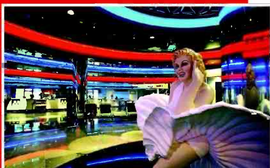
שמפניה ופופקורן. מתחם VIP בסינמה סיטי

לרגל ט"ו באב יוקרנו במתחמי ה-VIP בסינמה סיטי גלילות, ירושלים, ראשון לציון וכפר סבא מגוון סרטים רומנטיים. בנוסף, יקושו המתחמים ברוח החג וכוסות שמפניה יוגשו חופשי חופשי לזוגות האוהבים. בין הסרטים הרומנטיים שיוקרנו בחג האהבה העברי: "ערים של נייד", "איש ללא היגיון", "5 עד 7 ועוד. עוד במתחמי ה-VIP: אירוה יוקרתי ומפנק, לובי עם מגוון מאכלים, פופקורן, גלידה, שתייה חורפשית ועוד.