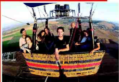
עד לגובה 5,000 רגל. טיסה בכדור פורח

פרטים: סקייטרק, עמק יזרעאל. טל: 04-8010023