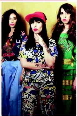
גלובל ביט חדשני. A-WA

Bordeline. שישי. החל מ-14:00. אוןבר, תל אביב