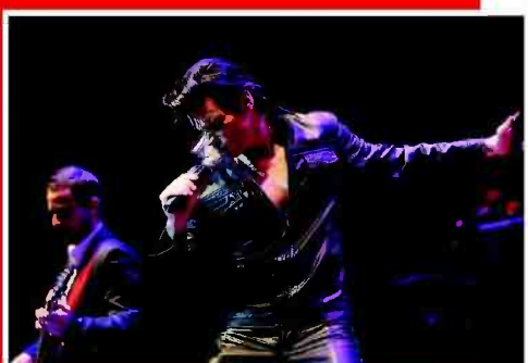
עד לשורשים. "מוזס סי" בעוולה

אם אלביס פרסלי (1935-1977) יקום בט"ו באב לתחייה, זה יהיה הרבה בזכות להקת "מוזס סי" - מבית היוצר של "פריד אשרת הפקות" - שתציג מופע חדש ומקורי שי מריא מעל ומעבר לפנ המוזיקלי המקצועי, יסרוק ויסקור את קיצור תולדות אלביס עד לשורשים. המופע מתמקד באופן כרונולוגי בתחנות חשובות בחייו, ומשלב את מיטב להיטיו מכל הזמנים, בשיי לוב קטעי וידיאו מסרטים עלילתיים ודוקומנטריים.