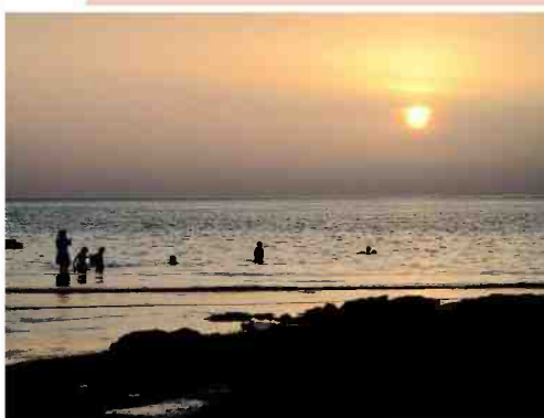
הרוח והחושך והמים. שקיעה בחוף הבונים

31.7. שישי. הרשמה מראש ובתשלום בטלפון *3639