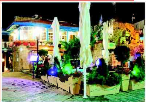
שתי כוסות קאוזה על חשבון הבית. אבראג'

אבראג'. כיכר קדומים 6, יפו העתיקה. פרטים: http://abrage.co.il/he/ 03-5244445 :70 home