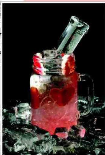
קוקטייל ייחודי. הסוהו