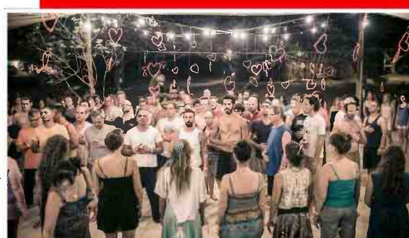
סדנאות עומק. "אשרם במדבר"

"אשרם במדבר" - שלושה ימים של פסטיבל אינטימי פותח לב, תחת גג זרוע כוכבים, מסיבות שמחות, מפגשי מדבר, מדיטציות וסדנאות עומק המכוונות אל הלב, המאכלסות את כל הקליטאות שמדבר רות על חיבור עם העצמי והאחר, והכל באווירה ביתית ומשפחתית.